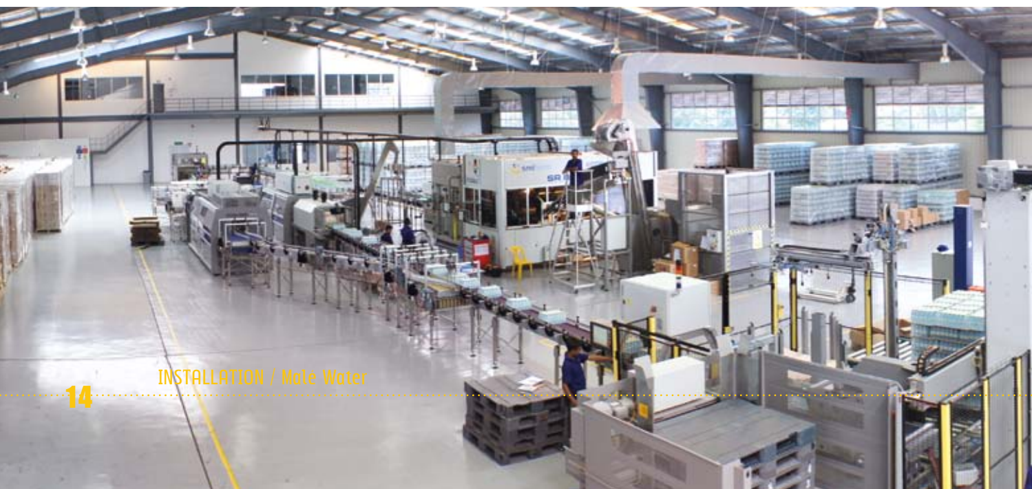
INSTALLATION / Malé Water

consentire la gestione dell'intera linea di imbottigliamento da parte di un numero ridotto di operatori. Grazie a questa configurazione compatta, che prevede una maggior vicinanza fisica tra le singole macchine, è stato anche possibile accentrare lo stoccaggio di tutte le materie prime necessarie a sopperire alla produzione giornaliera dello stabilimento, con il grande vantaggio di semplificarne e velocizzarne l'approvvigionamento; infatti, la zona di carico di preforme, tappi, etichette e altre materie prime e la zona di scarico dei prodotti finiti sono state posizionate sullo stesso lato della linea. Ne consegue la possibilità di adibire una sola zona alla movimentazione di bancali, materie prime, pacchi, ecc. e al transito dei mezzi utilizzati per tali operazioni logistiche, con l'indubbio vantaggio di rendere l'intero processo di produzione più lineare e continuo.