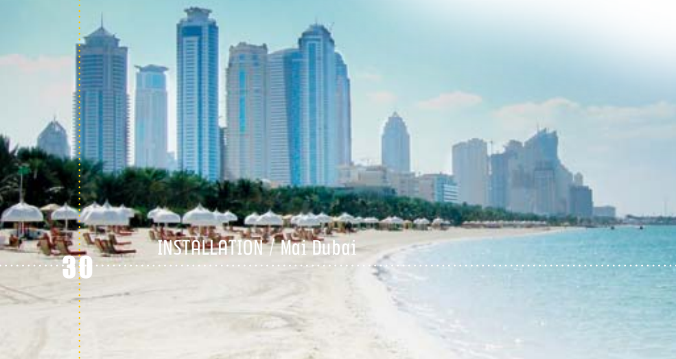
INSTALLATION / Mai Dubai

Questo miracolo nel deserto è reso possibile anche da una "pozione magica" che si chiama acqua dolce; un bene preziosissimo sottratto al mare in immensi impianti di desalinizzazione, un "oro blu" che irriga mille aiuole, giardini lussureggianti e una miriade di magnifici campi da golf.