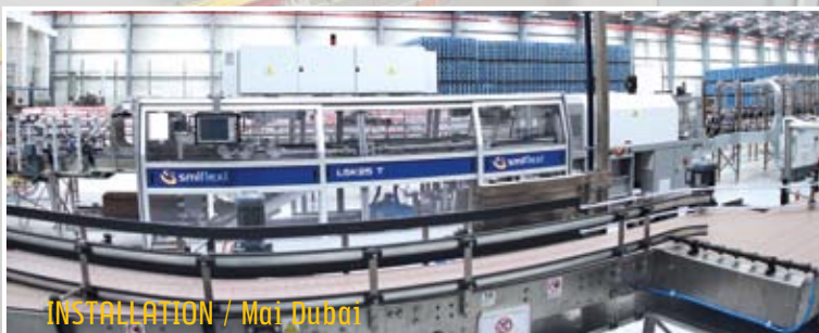
INSTALLATION / Mai Dubai