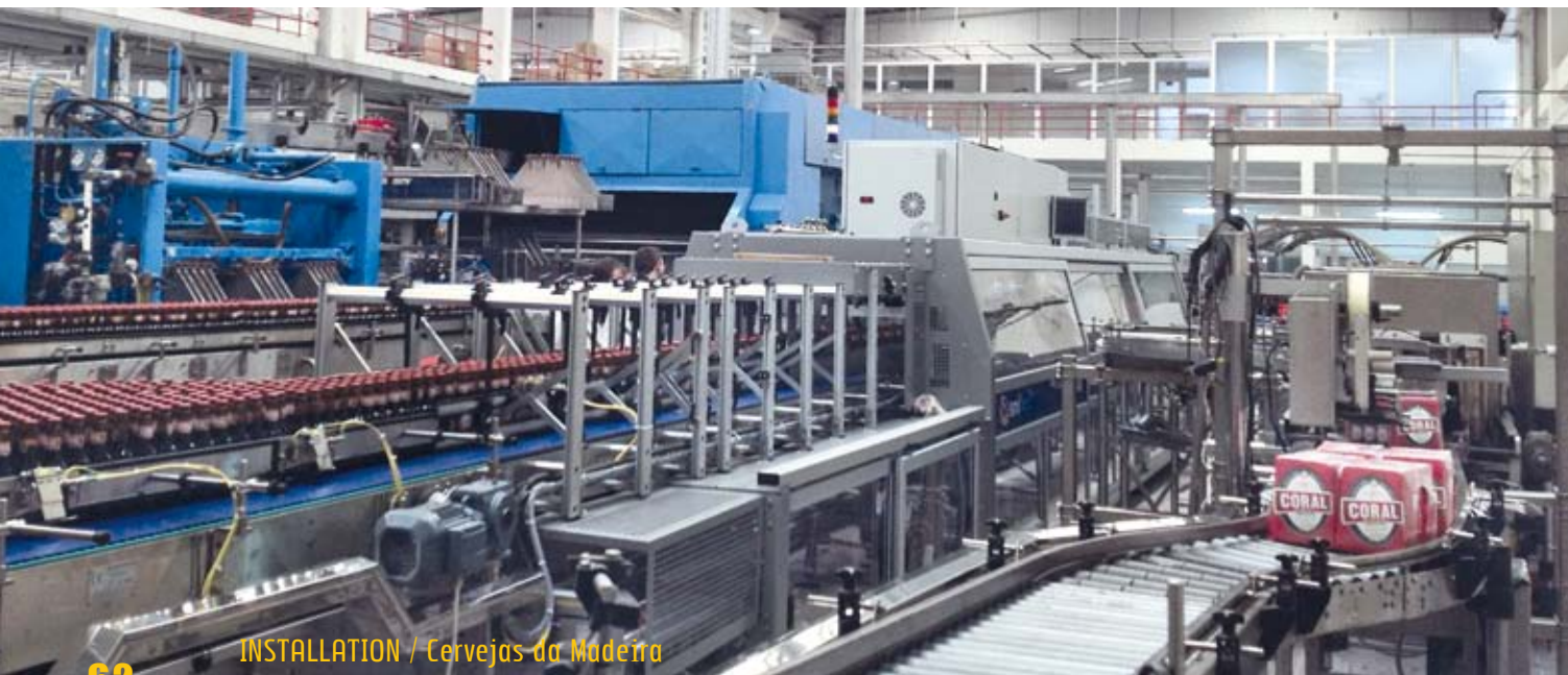
INSTALLATION / Cervejas da Madeira