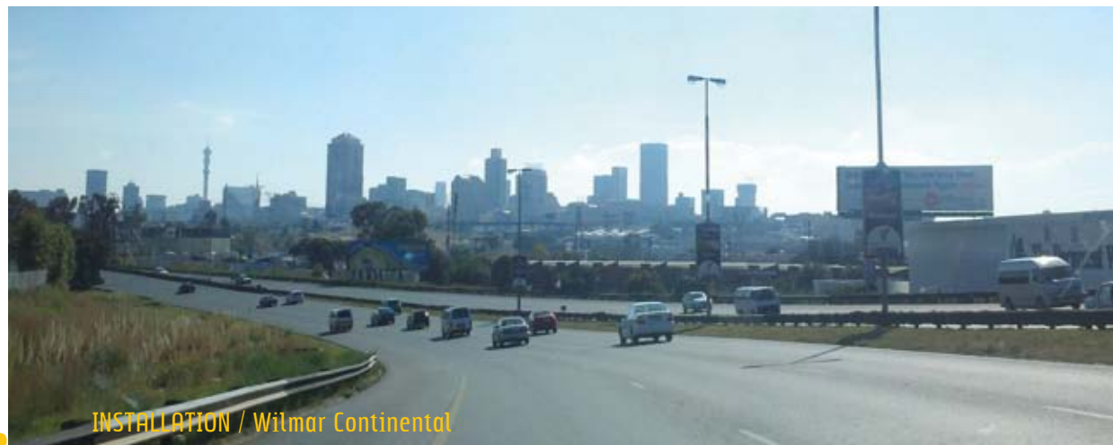
INSTALLATION / Wilmar Continental

que prevén varias unidades separadas (sopladora, llenadora y taponadora) para desempeñar las mismas funciones.