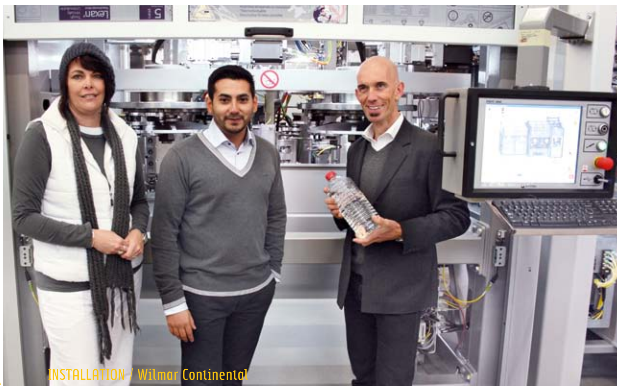
INSTALLATION / Wilmar Continental