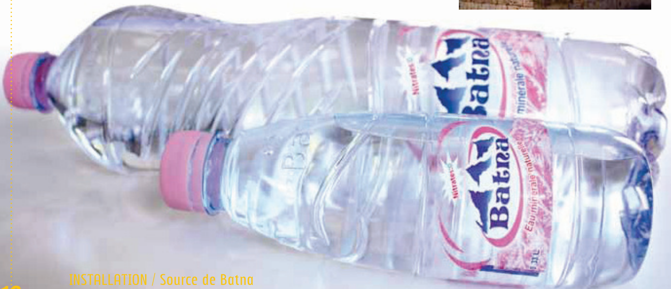
INSTALLATION / Source de Batna